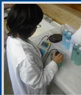
Contrôle de la qualité